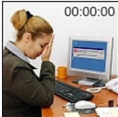
problemas con su PC

¡Tranquilícese! ¡El Protector Radix instantáneamente revive su ordenador en caso de mal funcionamiento!