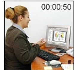
regreso a su trabajo

Radix Protector MLP protege su laptop y su ordenador